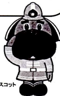
横浜市消防局マスコット ハマくん

なお、FAXで申込の場合は、氏名・住所・電話番号・希望日時(am, pm)を記入ください。