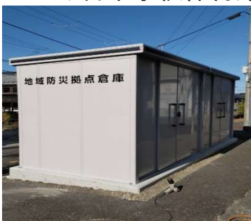
みたけ台町内会 HP/ホームページ ←2024/8/1 開設も仮 Upload 中