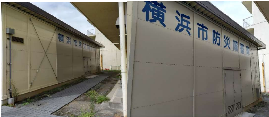
みたけ台中学校校舎西側にある、防災備蓄庫