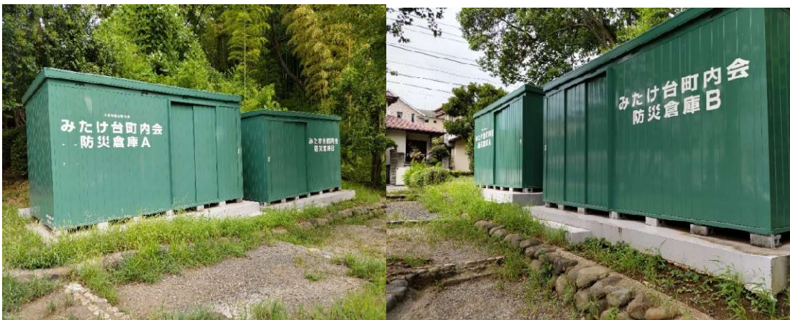
みたけ台公園の南側にある防災倉庫 2基